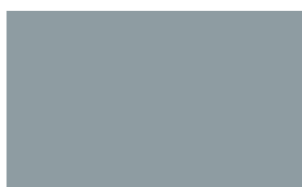
GRIS CLAIR RAL 7045