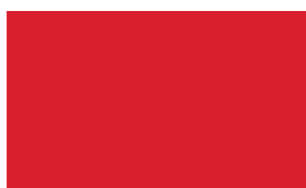
ROUGE BENETTON RAL 5302