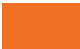
ORANGE RAL 2004V